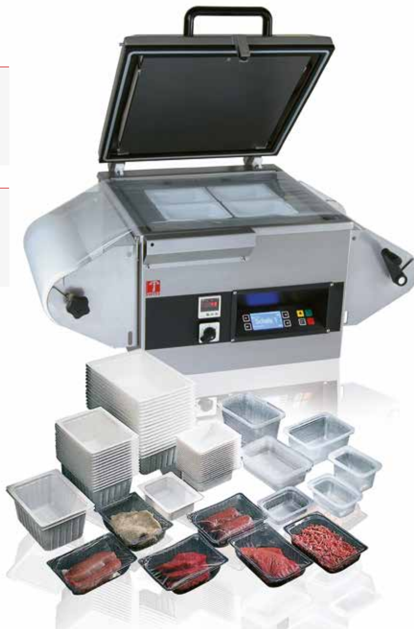
Mod. S-220 Multipacker

Multipacker permite el envasado de bolsas o barquetas. En un minuto transformará la multipacker de una envasadora de bolsas a una de barquetas con y sin inyección de gas.