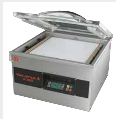
Mod. S-225 PX