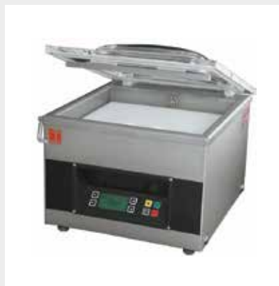
Mod. S-210 PX