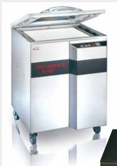
Mod. S-240 PX