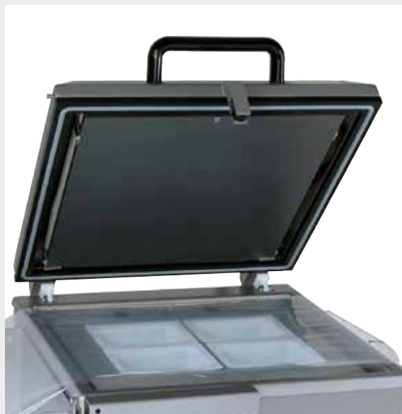
Detalle envasado barquetas