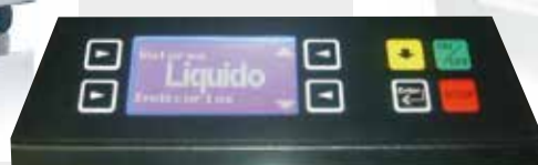
Panel de mandos digital de cristal líquido alfa-numérico