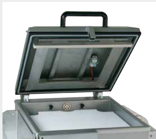
Detalle envasado bolsas (accesorios en dotación)