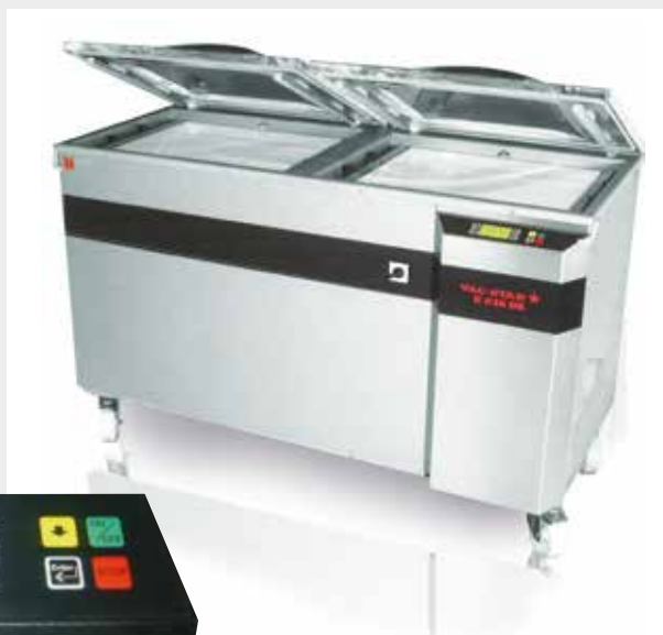
Mod. S-240 DK PX