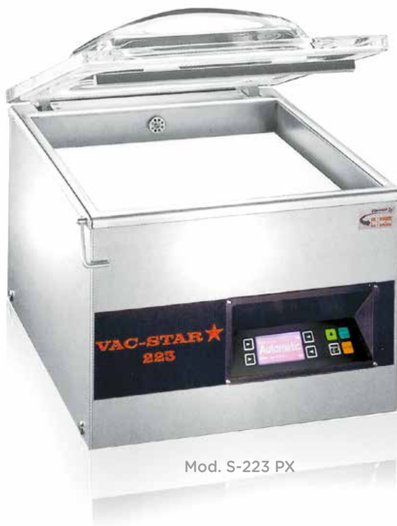
Mod. S-223 PX